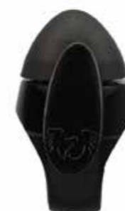
25.4 All black