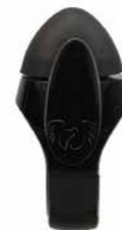
31.8 All black