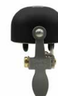
All stealth black