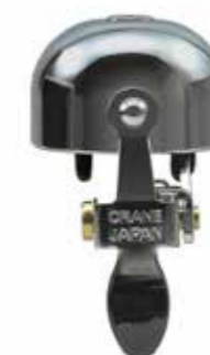
All chrome plated

物料: 铜 / 铝合金 安装: 夹带安装座 圆鼓 Ø: 37mm 安装 Ø: 22.2mm & 31.8mm 重量: 53g 铜 / 38g 铝合金